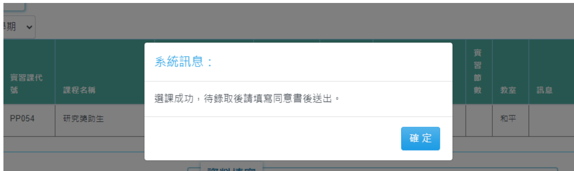
研究獎助生已選課程列表